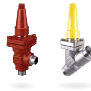
SVL Flexline™ – Componentes de línea

Todos los productos se basan en un diseño modular; el cuerpo no incorpora ninguna función. Este tipo de configuración minimiza la complejidad durante las etapas de diseño, instalación, puesta en servicio y mantenimiento. Todo ello está destinado a reducir los costes totales asociados al ciclo de vida y proporcionar el máximo ahorro.