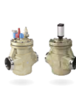
ICV Flexline™ – Válvulas de control

Diseñada para proporcionar sencillez inteligente, la máxima eficiencia y una avanzada flexibilidad, la serie Flexline™ se compone de tres populares categorías: