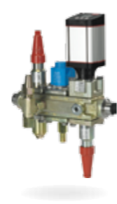
ICF Flexline™ – Estaciones de válvulas completas